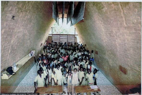
Diferents imatges del projecte 'Fem Escola'.